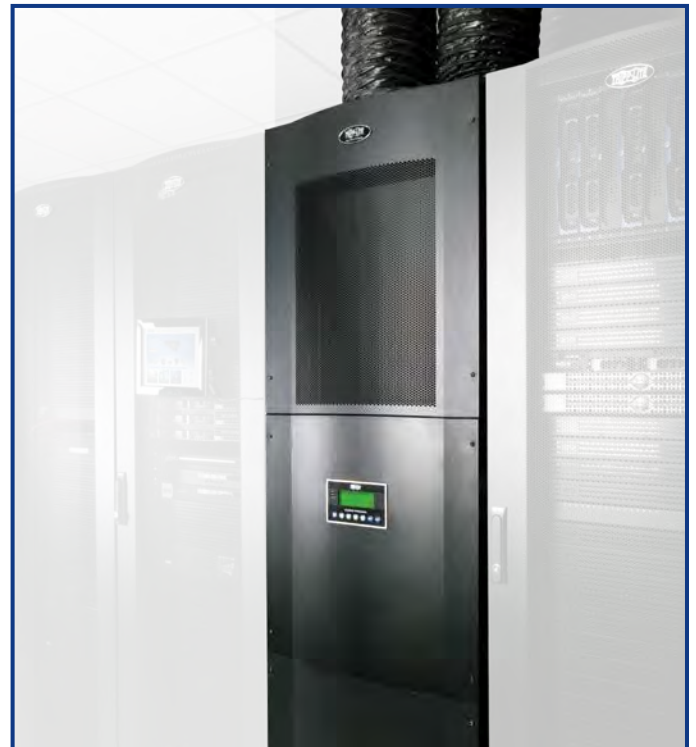
El SRCOOL33K reside en la hilera del racks como un gabinete estándar de gabinete de rack de 42U para proporcionar alta capacidad de enfriamiento de acoplamiento directo.