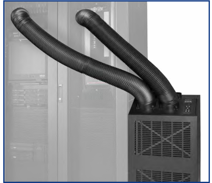
El SRCOOL24K puede concentrar el enfriamiento a través de dos conductos de salida flexibles (se muestran) o proporcionar enfriamiento al área a través de una ventila ajustable.