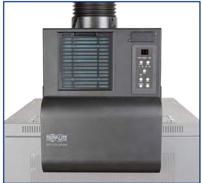
El SRCOOL2KWM está diseñado especialmente para enfriamiento de los gabinetes para instalación en pared.