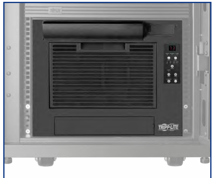
SRCOOL7KRM es la primera unidad de aire acondicionado para instalación en rack diseñada para enfriamiento de TI.